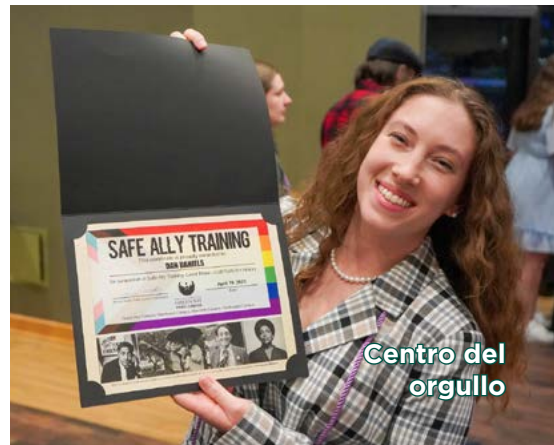
Centro del orgullo