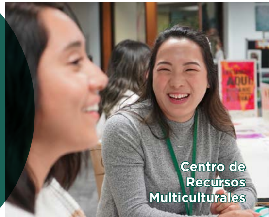
Centro de Recursos Multiculturales