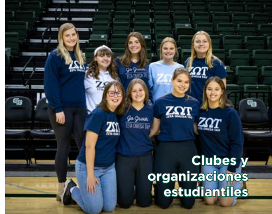
Clubes y organizaciones estudiantiles