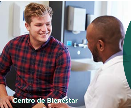
Centro de Bienestar