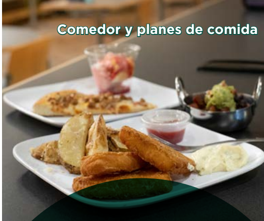
Comedor y planes de comida